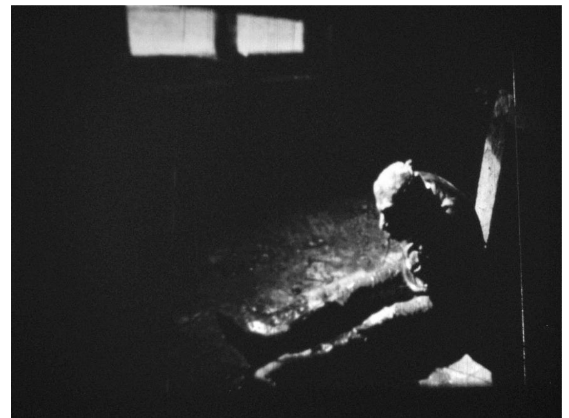
Christian Boltanski: l'Homme qui tousse .