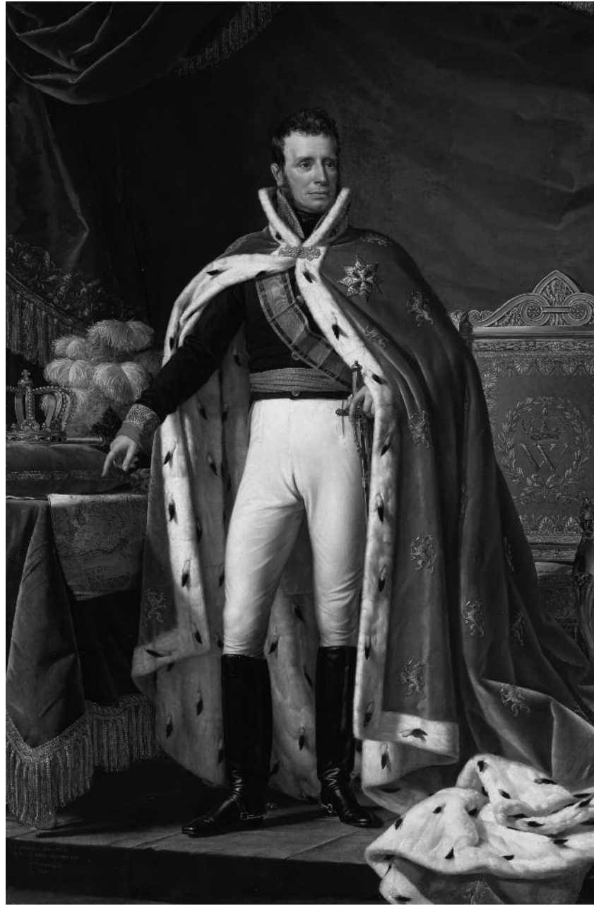
Willem I geschilderd door Joseph Paelinck, 1819.